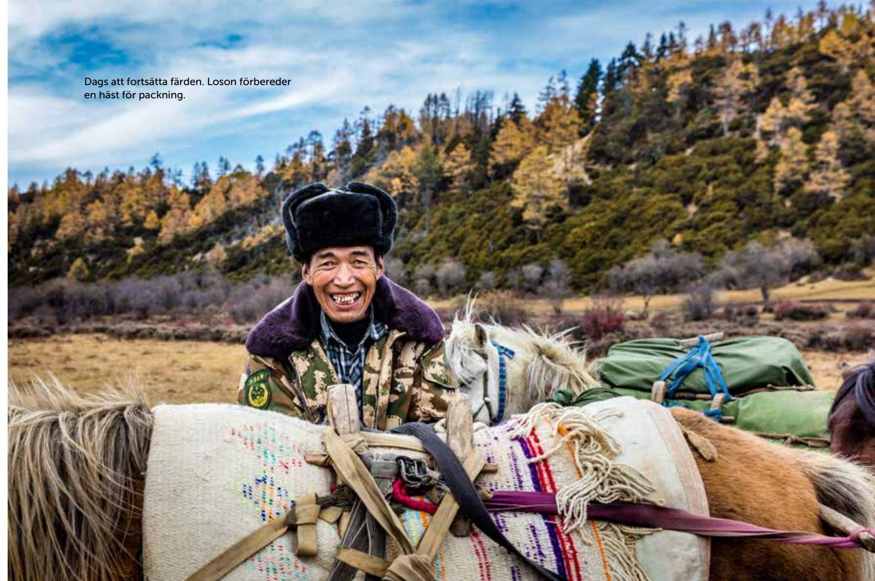
Dags att fortsätta färden. Loson förbereder en häst för packning.

När vår vandringsgrupp nu gör sig redo för att följa i karavanens spår är det i sällskap av ytterligare några hästar. Några av dem bär lite av ►