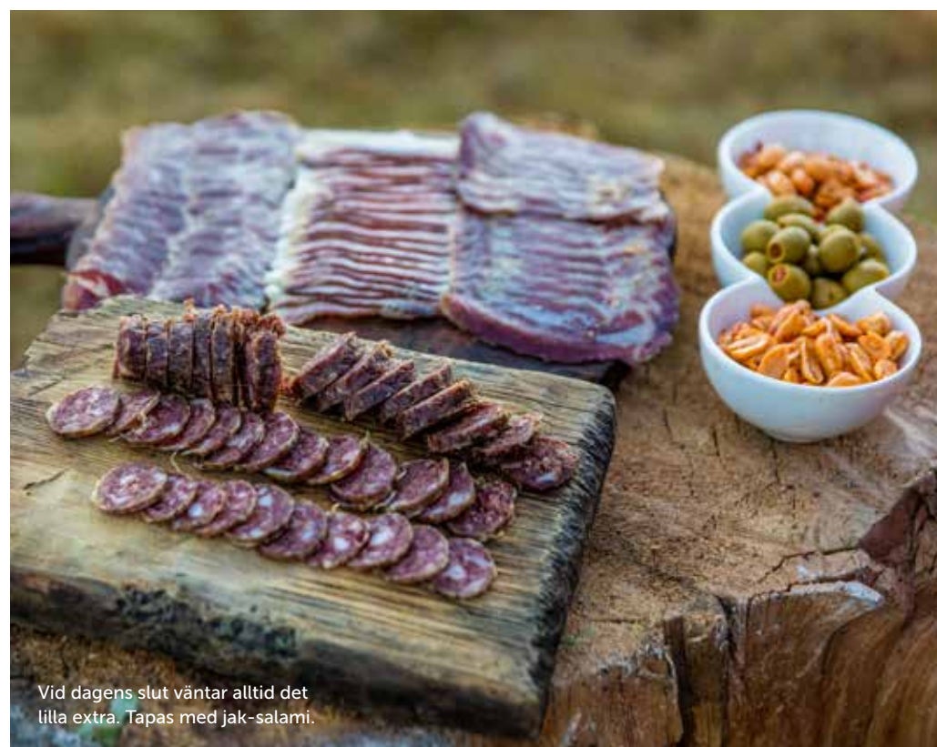
Vid dagens slut väntar alltid det lilla extra. Tapas med jak-salami.