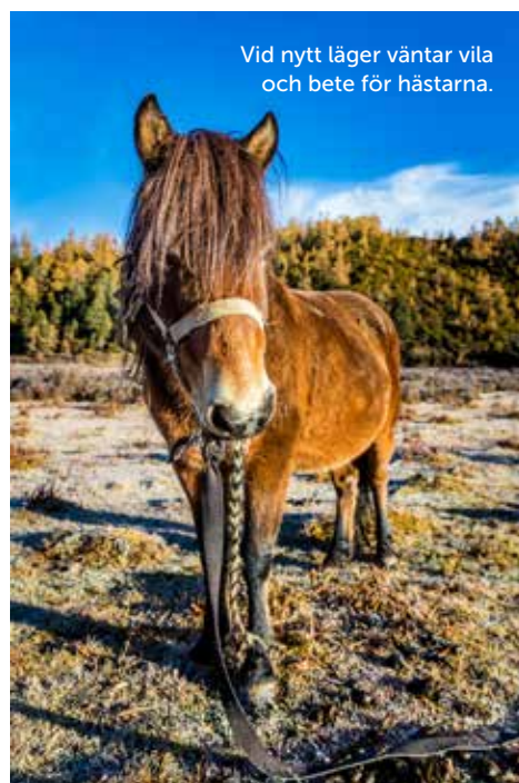
Vid nytt läger väntar vila och bete för hästarna.