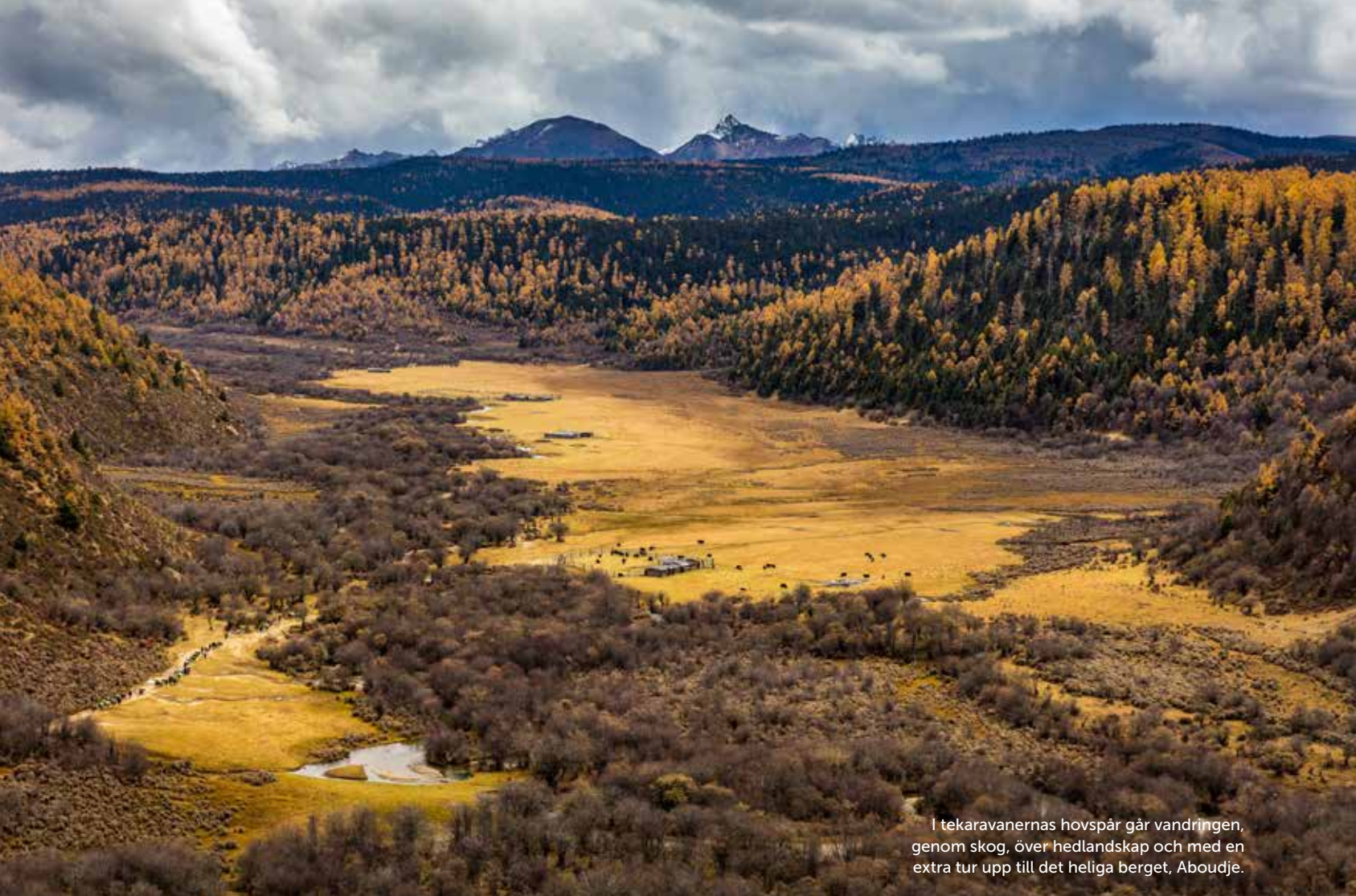
I tekaravanernas hovspår går vandrigen, genom skog, över hedlandskap och med en extra tur upp till det heliga berget, Aboudje.