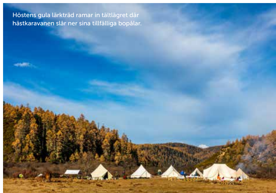
Höstens gula lärkträd ramar in tältlägret där hästkaravanen slår ner sina tillfälliga bopälar.