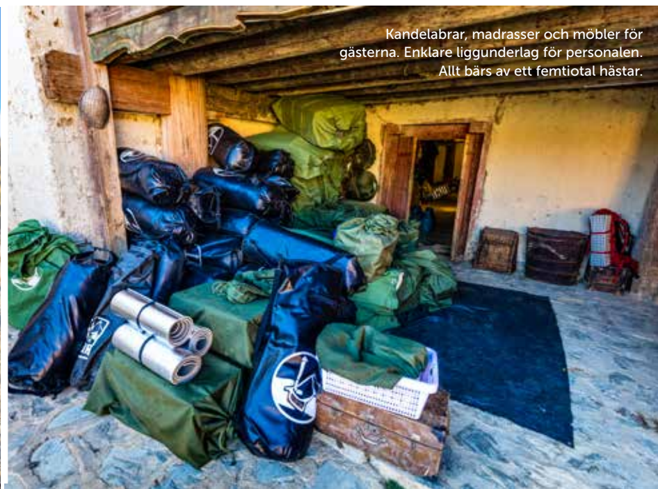
Kandelabrar, madrasser och möbler för gästerna. Enklare liggunderlag för personalen. Allt bärs av ett femtiotal hästar.

”NÄR FÖRFATTAREN JAMES HILTON 1933 SKREV SIN ROMAN LOST HORIZON BESKREV HAN SHANGRI-LA SOM EN UNDANGÖMD, UTOPISK TIBETANSK STAD, DOLD BLAND BERGEN I HIMALAYA.”